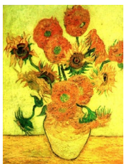
The Sunflowers by Van Gogh