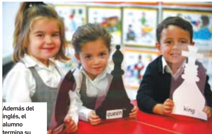
Además del inglés, el alumno termina su escolarización con altos niveles de francés.

El logro de estas metas y objetivos viene convenientemente apoyado por el trabajo serio y riguroso de un equipo docente implica-